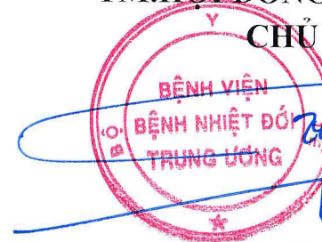
Phạm Ngọc Thạch