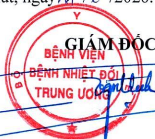
Phạm Ngọc Thạch